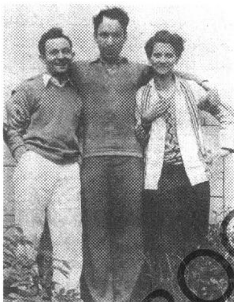
بنیان‌گذاران تئاتر گروه: هارولد کلرمن، لی استراسبرگ، شریل کرافورد.

تئاتر گروه را پایه‌گذاری کرد، ویژگی‌های ستایش‌انگیزی در شخصیت خود نهفته داشت. او متفکری بود با توانایی‌های نمایشی، آرمان‌پرورازی با ذهنی روشن دربارهٔ اقتصاد و مسایل سیاسی، مردی که با هیجان حرف می‌زد و به آنچه می‌گفت عمل می‌کرد، مردی که قادر بود نظریه‌ها را به عمل تبدیل کند، مردی بود خاکی، گرم و بذله‌گو که به دوردست‌ها می‌نگریست. مردی بود تحصیل‌کرده که در جوانی بسیار سفر کرده بود و قبل از آن که به سی‌سالگی برسد فرهنگ پاریس و نیویورک را به خوبی می‌شناخت. بنابراین تئاتر گروه بر پایه‌هایی محکم و استوار از تفکر و عمل بنا شد. در این راه شریل کرافورد و لی استراسبرگ (که در آن زمان مردی کم‌حرف بود ولی به گفتهٔ کلرمن بیش از هر شخص دیگری در مورد بازیگری می‌دانست) او را همراهی کردند. ۱۱